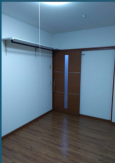
居室 6.6 畳