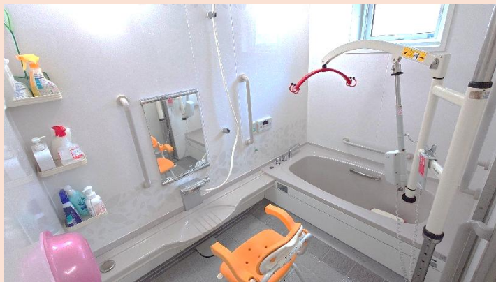
お風呂(機械浴あり)